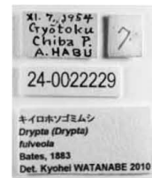
図4 土生コレクションに含まれる一般標本とそのラベルの一例(千葉県産のキイロソゴミムシ; 農環研所蔵標本番号 24-0022229)。採集ラベルの他に、黄色の標本番号ラベルと同定ラベルが付されている。本種は東京湾と外房の沿岸部に分布し、自然度の高い干潟の葦原のみに生息する。環境省レッドリストでは絶滅危惧I類に指定されている。本標本の採集地では既に絶滅したとされている。