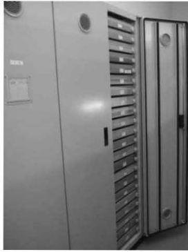
図1 土生コレクションの収蔵状況