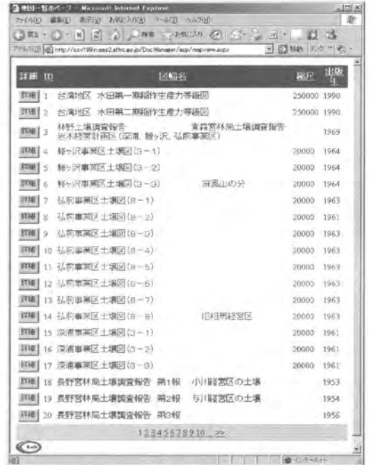
図3 土壌図一覧表示