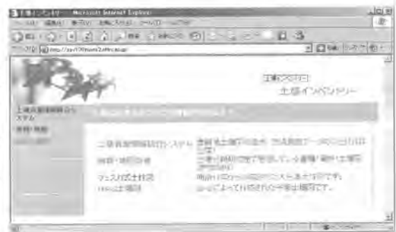
図 1 土壌インベントリーのWebページ

書籍等については書名、著者、出版社、出版年、出版月、分類ラベル、備品番号、および書架、土壌図・地図については図幅名、地域名、縮尺、出版社（作成者）、出版年、出版月、および寄贈者をフィールドとする PostgreSQL のデータベースを作成した。Web ページからアクセスすることで、一覧表示と検索ができる（図 1～4）。