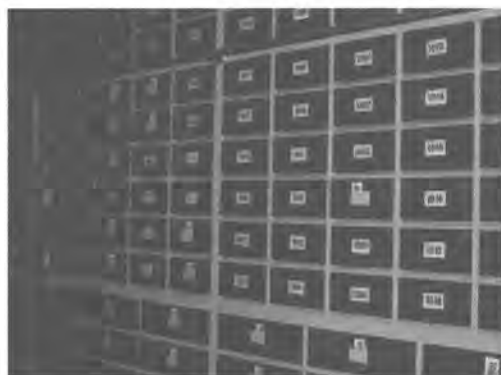
さく葉標本などを保存する標本棚