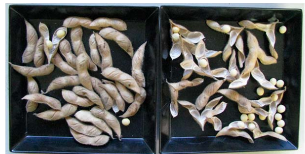
写真 「サチユタカA1号」(左)と「サチユタカ」(右)の裂莢性の違い

2) 加熱処理は60℃、3時間通風乾燥、自然裂莢は成熟後1ヶ月間圃場に放置して調査