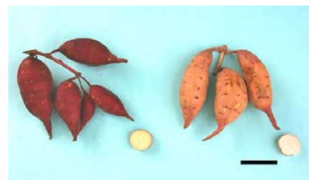
写真2 「ほしこがね」のいも 左：「ほしこがね」、右：「タマユタカ」 横線は10cm