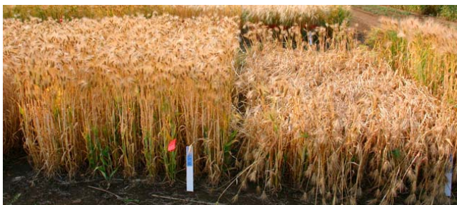
カシマゴール カシマムギ 成熟期以降に麦稈が折れにくい麦茶用新品種「カシマゴール」

ら通常品種と特性の異なる糯性の高β-グルカン品種を育成します。また、高β-グルカン系統を簡易に選抜する技術開発や、麦ご飯の匂いや精麦の黄色成分に関する研究にも取り組んでいます。近年、普及品種の硝子粒率の発生が高くなるという品質面の課題があります。六条大麦・裸麦では硝子率の発生が高いと、精麦会社からは加工しにくいと敬遠されます。硝子率が高くなる要因は解明されていませんが、一つの切り口として、硝子率発生が低くなる遺伝的要因を有する品種の育成を目指しています。