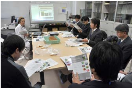
小麦品質評価法の実習

平成24年12月6日～7日開催された標記研修に、岩手県から宮崎県まで7県の普及指導員が参加しました。小麦の新品種育成動向や、品質評価法や湿害評価法、赤かび病対策技術を習得してもらうため、講義と実習を行いました。