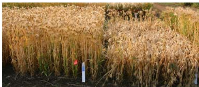
写真2 成熟期の稈の折れの差異 左「カシマゴール」 右「カシマムギ」