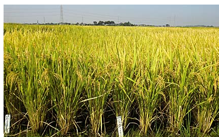
写真1. 「ほしじるし」の圃場での草姿

注 コシヒカリを基準(±0)とし、総合および外観は-5～+5、うま味、粘りおよび硬さは-3～+3で評価。材料は、いずれも早植・標準施肥。