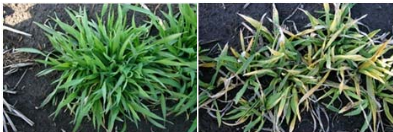
写真1 縞萎縮病汚染圃場(II型ウイルス)での発病程度の差異 左「カシマゴール」 右「カシマムギ」

「カシマゴール」は、縞萎縮病抵抗性で麦茶適性を備える関東皮78号(のちの「さやかぜ」)を母、