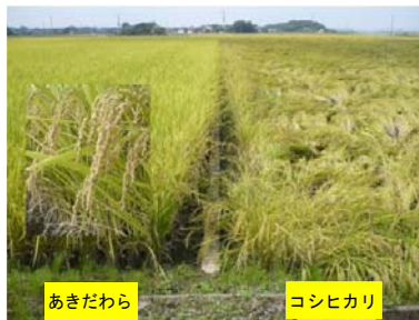
図1. 「あきだわら」の圃場での草姿

多いことです。多肥栽培では標準施肥栽培の「コシヒカリ」より30%程度の多収です。「コシヒカリ」より短稈で耐倒伏性は優ります（図1）。食味は「コシヒカリ」に近く良食味です。玄米の外観品質は同熟期の「日本晴」並で「コシヒカリ」と同等かやや優ります（図2）。成熟期は「コシヒカリ」より11日遅く、関東平野部では「日本晴」並の“中生の晩”熟期に属し、栽培適地は関東・北陸以南です。ただし、「コシヒカリ」同様、いもち病と縞葉枯病に弱いのが欠点です。