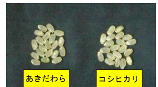
図2. 「あきだわら」の玄米