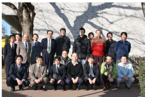
飼料用水稲品種研究開発グループ

全国で生産される稲発酵粗飼料の半分以上が当グループの育成した品種によると推定されています。また、飼料米としての利用も急速に広がっており、今後さらに利用の拡大が見込まれています。飼料用水稲品種の利用は、国内で大きな需要がある飼料の生産を行いながら水田の機能を完全に保つことを可能とし、さらに、国際食料価格が急騰した場合でも飼料生産から食用米への切り替えが容易になることから、食料の安全保障に大きく貢献できます。