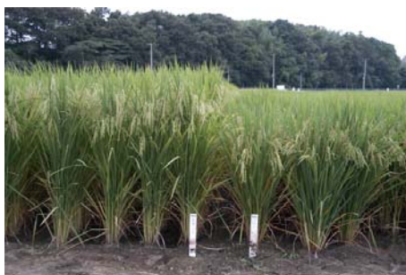
図1. 「たちすがた」の草姿 (左、たちすがた; 右、タカナリ; 茨城県つくばみらい市)