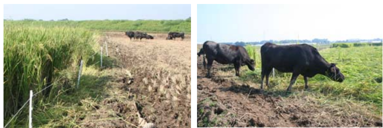
図2. 「たちすがた」を利用した繁殖牛の水田放牧 (茨城県常総市、平成20年)