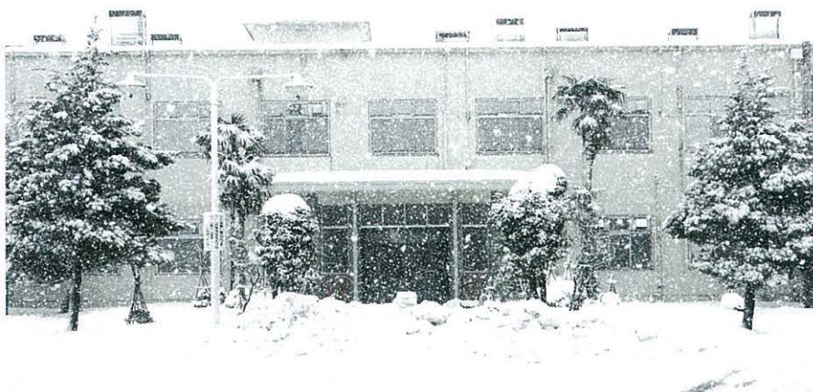
中央農研北陸研究センター（2016年1月25日）

農研機構は、各地域に所在する研究センターを農業研究のフロントラインと位置付けて重点化する計画です。北陸研究センターでも、その一翼を担っていきたくと考えています。