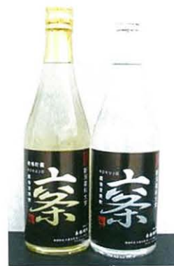
図1 新潟県産ゆきみ六条を原料につかった「地産地消焼酎」

ゆきみ六条は北陸研究センター初の大麦品種です。大麦には有力な転作作物、地域の食品産業原料としての重要な役割があります。これからも、ベータグルカン含量が高く麦飯の食感が優れる「もち性」大麦や、全粒粉としての利用が可能な「はだか性」大麦など、従来の雪国向け品種にはなかった「高付加価値大麦」をスピード感をもって開発していきます。