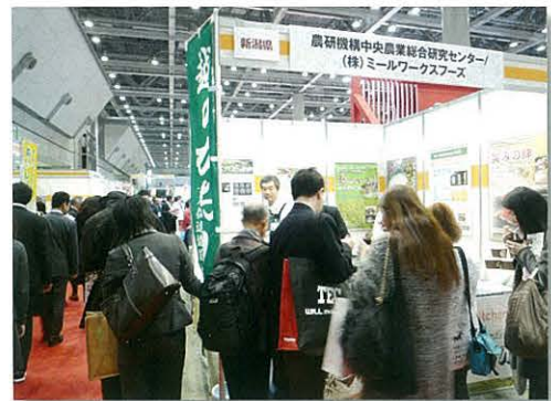
第11回こだわり食品フェア2016

北陸研究センターでは、高アミロース米「越のかおり」、カレー向き水稻品種「華麗舞（かれいまい）」等の品種紹介を積極的に行うとともに、「越のかおり」の特長を生かした米麺や「華麗舞」を使ったカレーライスの試食を行い大変好評でした。