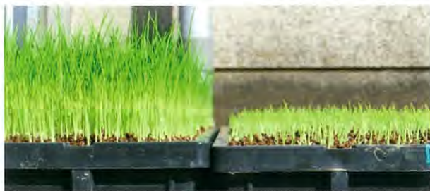
図1 緑化後の出芽期伸長処理苗（左）と無処理苗（右）

北陸193号の種子を播種後、出芽器内での芽だし加温期間を標準より約3日間延長し、5cm以上に芽を伸ばした後に置床し（図1）、通常通り育成