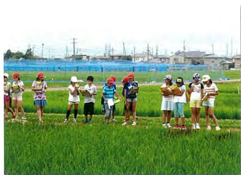
変わったイネ品種の田んぼ観察