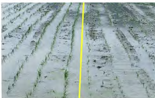
図3 移植直後の5cm プール苗（左）と無処理苗（右）

する出芽期伸長処理により、苗丈と苗の重量を高めることができました（図2）。このとき注意点として、出芽期伸長処理後は白化苗が発生しやすいことから、置床後すぐには直射光にさらさず、被覆資材を用いるなどして十分に緑化を行う必要があります。また、出芽期伸長処理では、出芽器内で苗箱の積み重ねを行えないため、必要な箱数と出芽器の苗箱収容能力に留意する必要があります。ただし、出芽期伸長処理を行わなくても、置床後に被覆資材を用いて加温を行うことや、1葉期以降に箱上水位を5cmと深くしたプール育苗を行うことでも、出芽期伸長処理と同様に苗丈を伸ばすことができ、これにより移植後の水没を避けることが可能です（図3）。