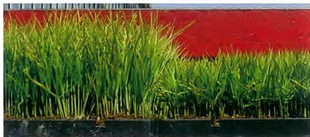
図2 育成後の出芽期伸長処理苗（追肥なし：左）と無処理苗（右）