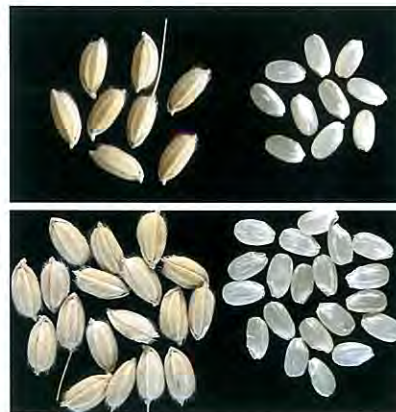
写真1 「あみちゃんまい」の籾および玄米（上段：あみちゃんまい、下段：コシヒカリ）

アミロースの「あみ」、親しみやすい「ちゃん」、米や私の「まい」を合わせて、広く親しみやすく、覚えやすい名称にしました。