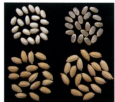
写真2 「亀の蔵」の玄米および粉 左: 亀の蔵、右: あきたこまち