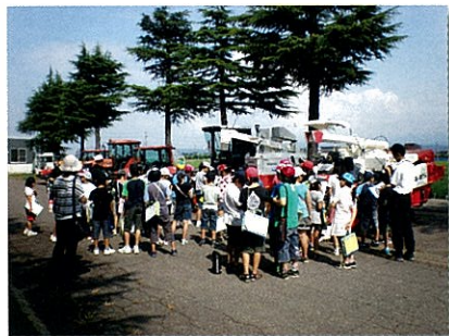
展示圃場・農業機械