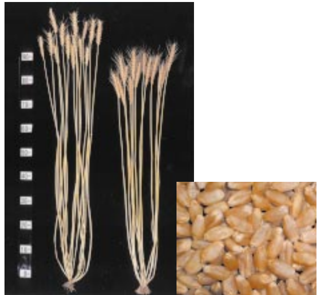
写真1 「タマイズミ」の株と粒 (左：農林61号、右：タマイズミ)

暖地向けの硬質小麦として既に「ニシノカオリ」が育成されており、今回温暖地向けの硬質小麦として「タマイズミ」が育成されたことで、関東以西の地域において、国産硬質小麦の新たな利用が広がっていくことを期待しています。