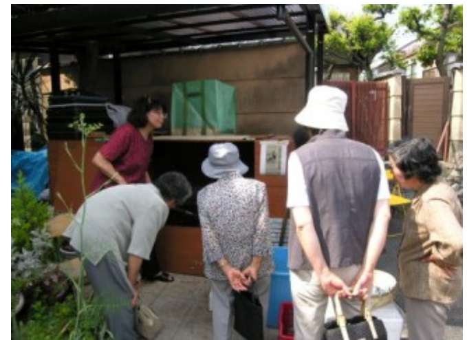
循環型産直交流会での生ゴミ堆肥づくり講習