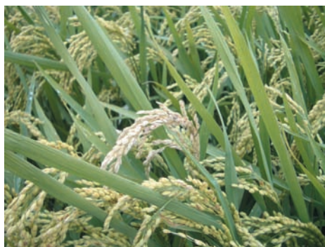
穂いもち病に罹病した穂

この「宮崎もち」の穂いもち抵抗性には、第9染色体と第11染色体に存在する2つの遺伝子座 ( qPbm9 、 qPbm11 ) が関わっています。特に、第11染色体の遺伝子座 qPbm11 は、単独でも「宮崎もち」と同じ位に強い抵抗性を与えることができる新しい抵抗性遺伝子座です。このような遺伝子座のより詳しい位置と、その位置を見分けるDNAマーカーを開発することができれば、この抵抗性を効率的に品種育成に利用でき、環境にも水稻生産者にも優しい品種開発が期待できます。