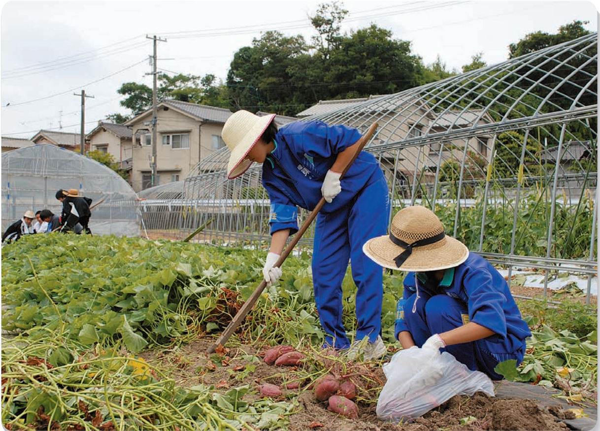
中学生の職場体験学習の様子（7頁参照）