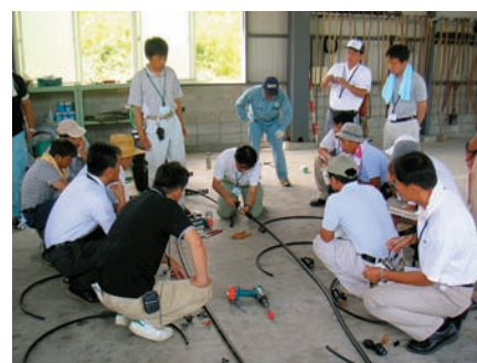
点滴かん水チューブの接続実習