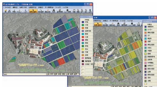
図1 「作業計画・管理支援システム」画面例 （左：作付け状況表示、右：作業進捗状況表示）

このシステムには、圃場情報（地図、所有者、地番、面積、土地利用など）、圃場所有者や作業者の情報、栽培する作物の情報、使用する肥料や農薬、機械などの情報、圃場ごとの作付けや日々の栽培管理作業などの情報を入力できます。これらの情報をデータとして入力・蓄積していくことで、農地の管理や作付け・作業についての情報管理や書類作成事務をお手伝いできるようになっています。