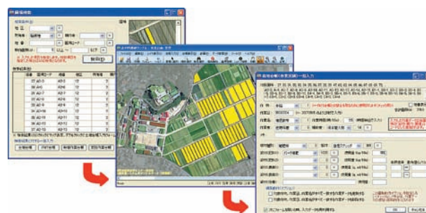
図3 データ一括入力の操作例 （左から圃場検索→選択圃場画面→一括入力）

理していると、一つ一つの圃場について日々入力するのは大変です。そこで、できるだけ複数の圃場に対して一度にデータ入力できるようになっています（図3）。