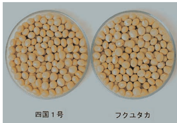
写真2 四国1号はフクユタカより蛋白質含量が高く、外観品質も優れています