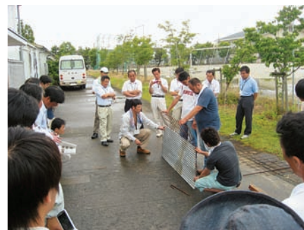
仮設の侵入防止柵による実習 （「金網忍び返し柵」のポイントは、折り返し30°の角度！）