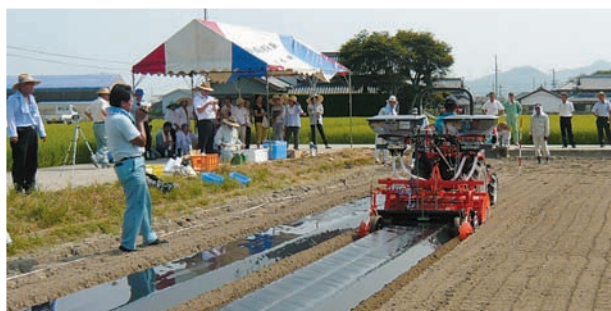
技術検討会（兵庫県南あわじ市）