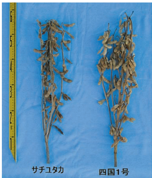
写真1 サチユタカよりも機械化栽培に適した四国1号

大豆育種研究近中四サブチームでは、近畿中国四国地域に適した大豆の品種育成を実施しており、これまでに有望な9系統を開発しました。この中で「四国1号」は青立ちが少なくコンバイン収穫に適しているなど機械化栽培適性は「サチユタカ」を上回っています（写真1）。また、「四国1号」は裂皮が少なく外観が美しい上、豆腐加工に重要な成分である蛋白質含量が高いなど良質系統で、国内品種の中で豆腐加工適性の評価が最も高い「フクユタカ」と比