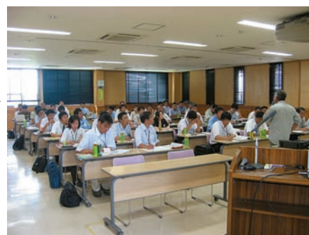
鳥獣害対策の基礎知識を熱心に聞く参加者