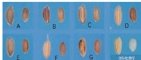
図2 採種された雑草イネの籾(左)と玄米(右)の外観形質 2006年まで発生していた雑草イネについて、生理形態的特長から類型化した7タイプを示す。