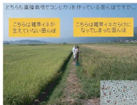
図1 雑草イネが多発した圃場と収穫物への赤米の混入

私たちが調査した地域では雑草イネは日本型（ジャポニカ）が多く、粉や玄米の色や形からいくつかのタイプに分けられます（図1、図2）。最もよく見つかる雑草イネはAタイプ