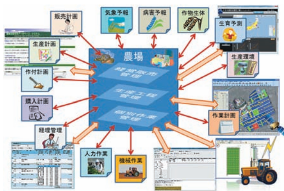
図 生産農家が接するさまざまな情報のやりとり

間で決まったデータの表し方を作り、各ソフトウェアがそれに対応すれば効率的です。現在そのような共通のデータの表し方を開発しています。(情報利用研究領域)