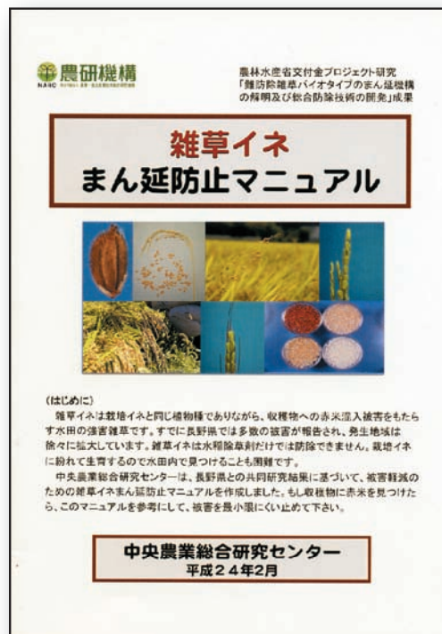
図4 雑草イネまん延防止マニュアル

3. 水稲作を継続する場合は移植栽培を行い、雑草イネに有効とされる除草剤を体系処理します。雑草イネ防除に有効な除草剤は、（公財）日本植物調節剤研究協会のホームページに掲載されています。ただし、1葉期を過ぎた雑草イネを枯殺することはできないので、その後の体系処理も早め早めに行います。