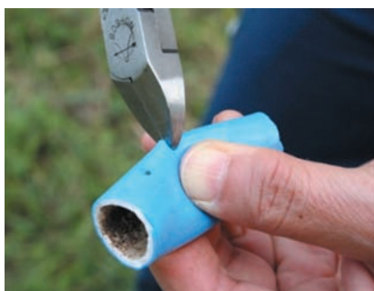
図2 弾性ボールの準備 水道用ホースにニッパーで切れ込みを付けて弾性ボールに差し通す