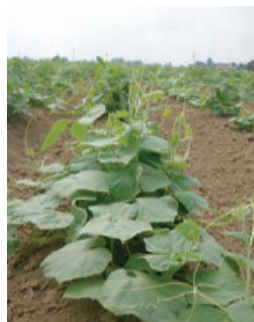
写真 中耕培土後に株間に残ったアレチウリが大豆を押しつぶす様子

おわりに このように、現在考えられる防除手段ではアレチウリの被害を回避することができません。すでに蔓延してしまった圃場では大豆栽培をあきらめたところも出てきています。今できることは、発生量が少ない段階で、それらが種子を落とさないよう