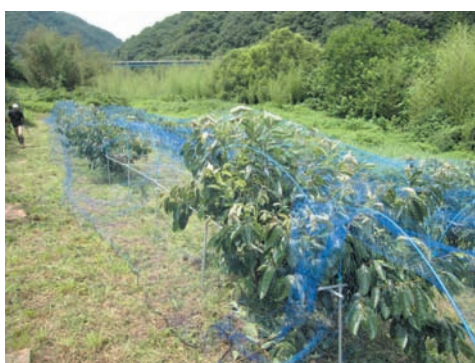
図4 果樹コンパクト栽培の低面ネット棚に防鳥網を 設置した状況

スイートコーンのような網に引っ掛 かりにくい作物では、植栽列ごとにパ イプを打ち込む必要はなく、数mおき にパイプの打ち込み列をつくりまします。 果樹をコンパクトに栽培する低面ネッ ト棚（奈良県と近畿中国四国農業研究 センターにおいて開発）では、パイプ を少し打ち足せば、防鳥網を掛けられ るようになります（図4）。