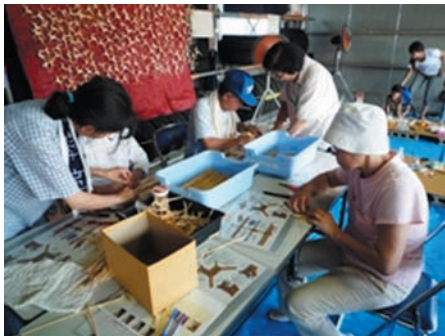
麦わら細工の体験

当日は天候・気温にも恵まれ、休日開催を行うて以来最高の来場者で賑わいました。皆様ご来場ありがとうございました。