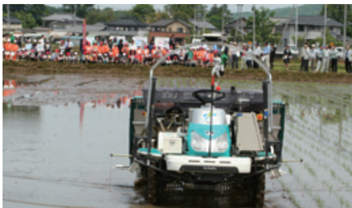
図3 小学生のためのデモンストレーション風景