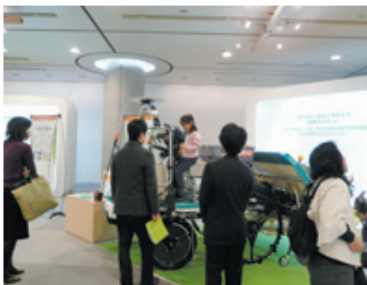
ロボット大賞展一般公開展示

図3のようにこれまで様々な場所でデモンストレーションを行ってきました。子供達には明るく楽しい未来ある農業を実感してもらい、将来の農業担い手の確保の一助になれるよう、また、真剣に労働コストの削減を目指す生産者からの熱い要望を受け止め、さらに開発を進めていきたいと考えています。