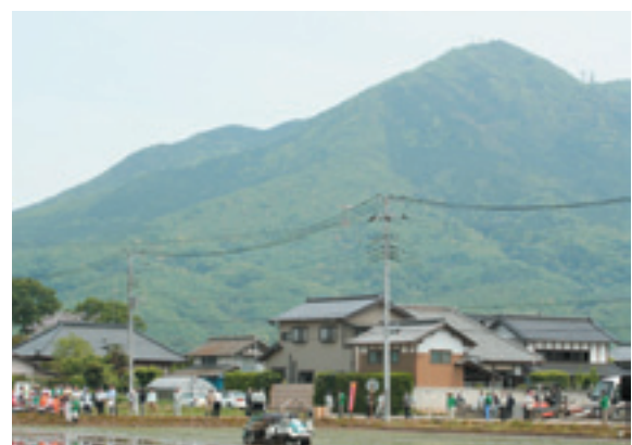
筑波山麓での実演