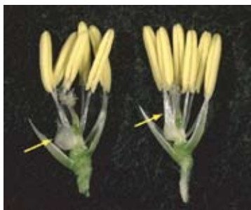
図3 閉花受粉性イネの花の内部構造 左:野生型 右:閉花受粉性イネ 閉花受粉性イネでは、おしべは正常だが、鱗被(矢印)が細長く伸長している。(内部が見やすいように、外穎と内穎を取り除いてある)

閉花受粉性の安定性を検証しつつ、多様な場面での利用を図っていきたいと考えています。