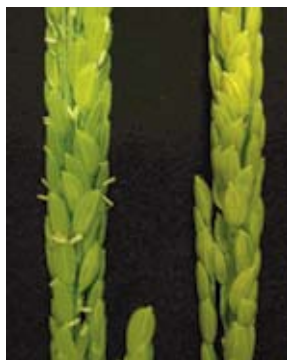
図2 閉花受粉性イネの穂 左:台中65号、右:閉花受粉性イネ 閉花受粉性イネではおしべが花の外に出ない。