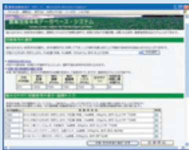
図1 入力画面例(その1)