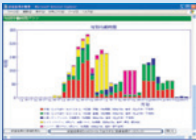
図3 出力画面例(その1)