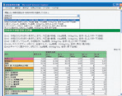
図4 出力画面例(その2)

●システムの概要 本システムは、Web上で、「栽培したい作物を選び、作付面積を入力す