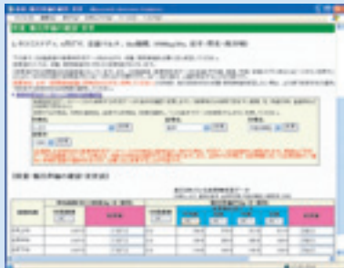
図2 入力画面例(その2)