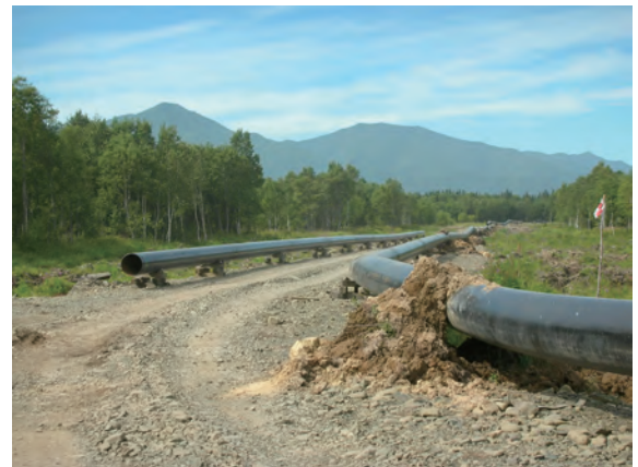
Photo 6. Pipe line under construction.