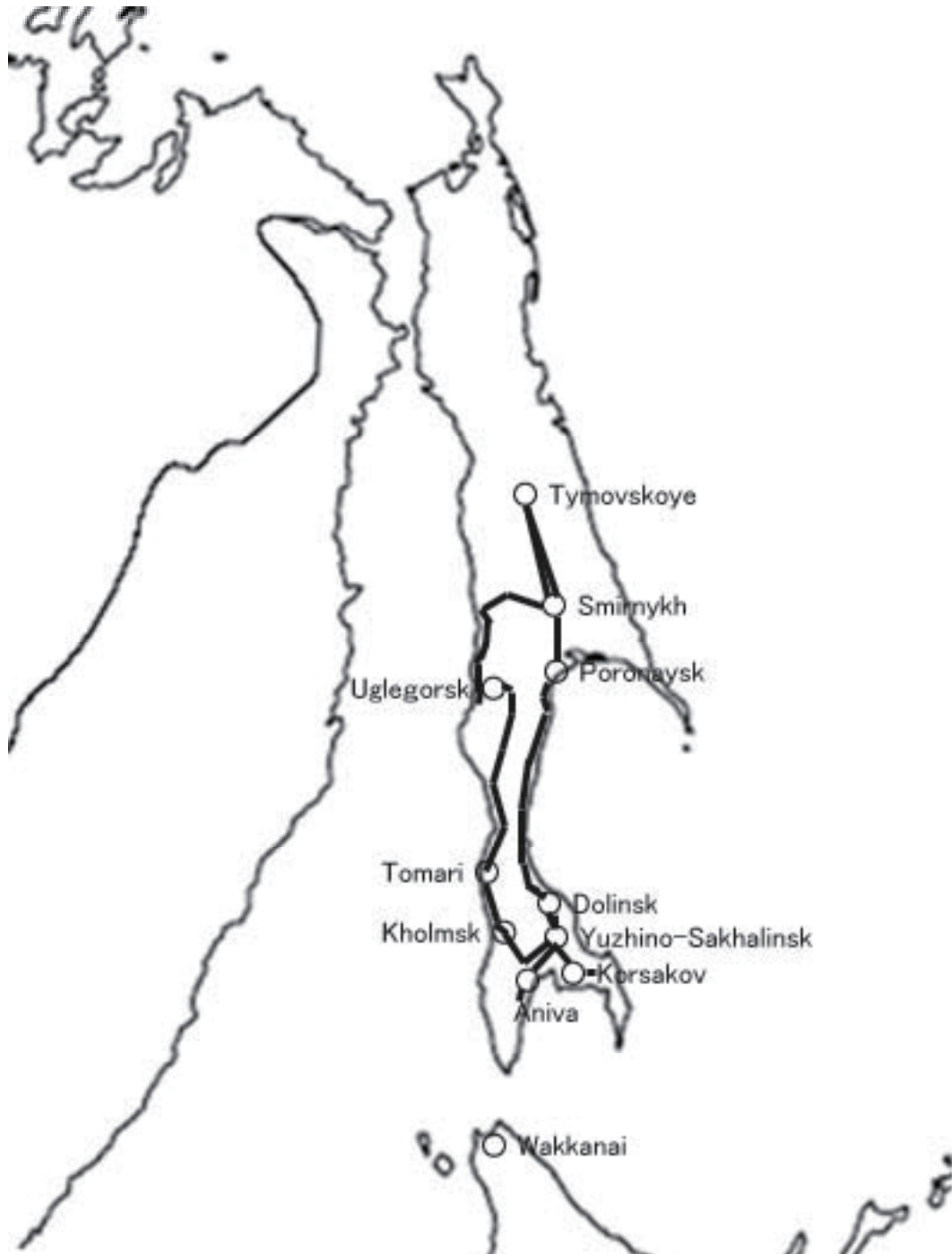
Fig.1. Exploration route of surveying and collecting genetic resources in Sakhalin.