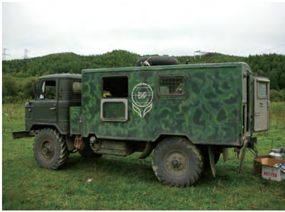
Photo 1. Vehicle prepared for this mission by VIR.