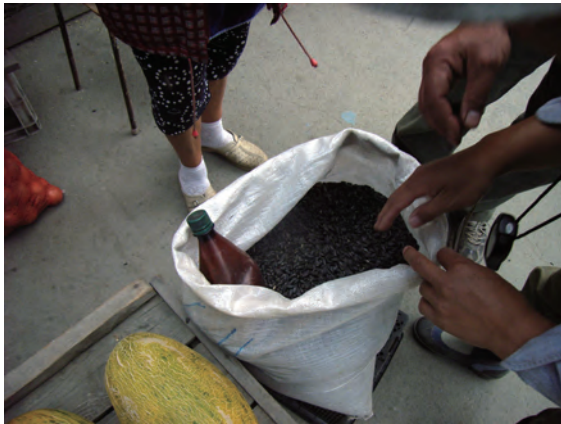
Photo 3. Sunflower seeds sold in a market, in which common buckwheat seeds were compounded.