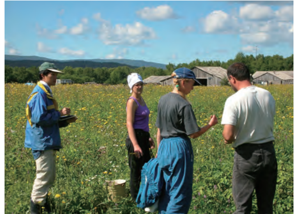
Photo 4. Exploration in Timovskoye where was the most northern point in this mission.