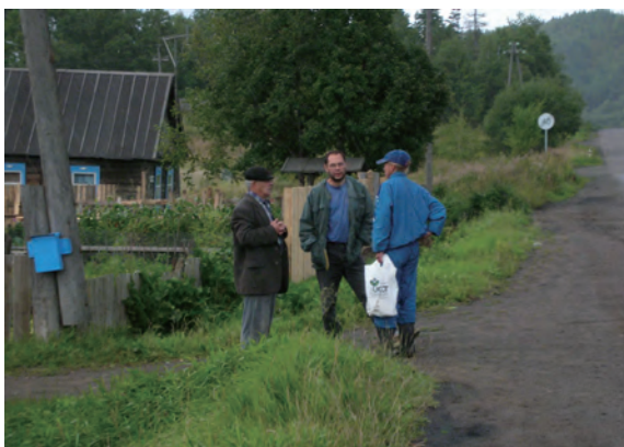
Photo 7. Gathering information in Medvezh'ye vil.