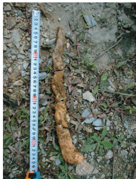
Photo 6. 自生のヤマノイモ類