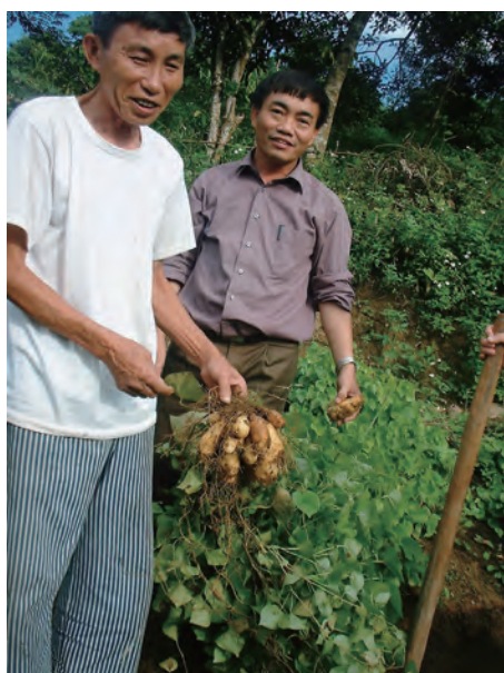
Photo 5. ヤマノイモ類の栽培農 家圃場