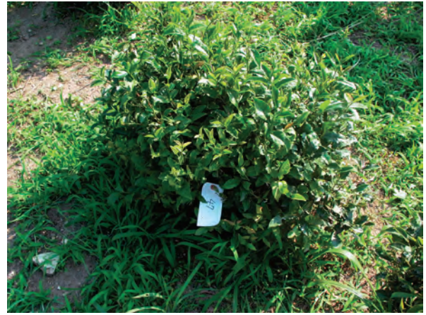
Photo 2. An example of tea plant collected. 個体の様子