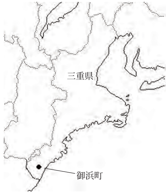
Fig.1. Mihama-cho, Mie prefecture 三重県御浜町

調査及び穂の採取は2004年6月14日に行った。採取地は南牟婁郡御浜町栗須の山田伸行氏所有の茶園である。個体の位置と大きさおよび本数を調査後、その年に伸びた枝を各個体10本ずつ採取し、水苔で保水し持ち帰り、野菜茶業研究所のガラス室内のペーパーポットに挿木した。2005年4月に鉢上げし、ガラス室で管理した。また、三重県科学技術センター農業研究部茶業研究室にも同様に持ち帰り、挿木を行い、2カ所での保存を行った。