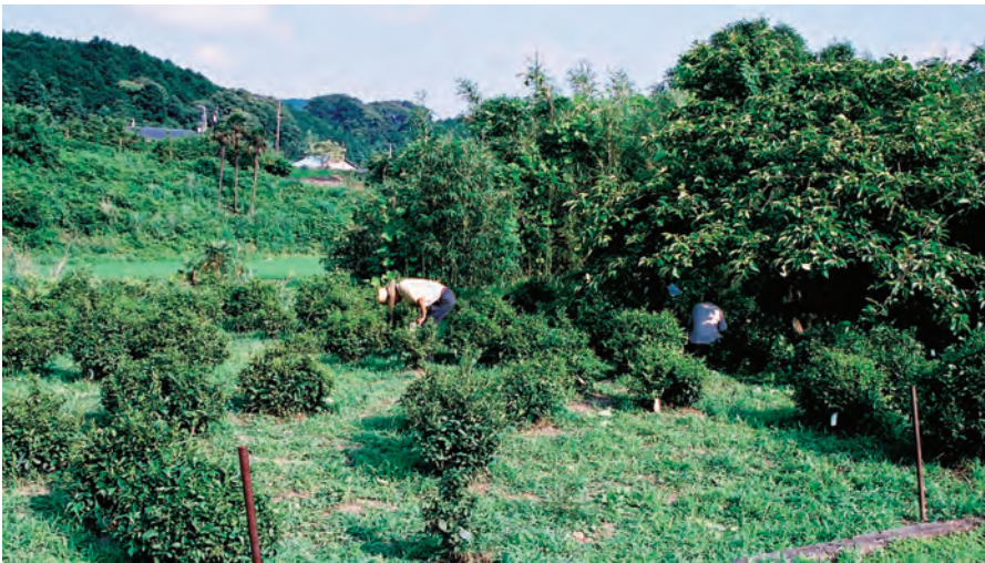
Photo 3. Field survey of tea plants.