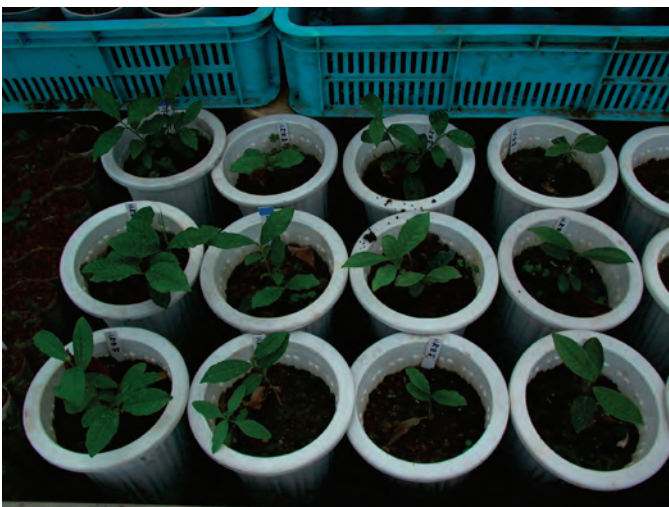
Photo 4. Tea plants planted in the pods. 鉢上げ後