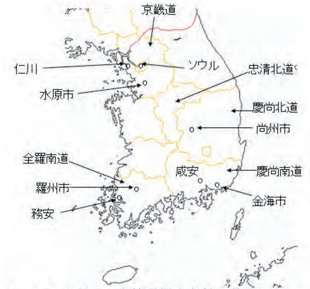
Fig. 1. Locations in Korea. 大韓国内各地の位置. ソウル Seoul, 仁川 Incheon, 水原 Suwon, 京畿道 Gyeonggi-do, 全羅南道 Jeollanam-do, 羅州 Naju, 務安 Muan, 慶尚南道 Gyeongsangnam-do, 金海 Kimhae, 咸安 Haman, 慶尚北道 Gyeongsangbuk-do, 忠清北道 Chungcheongbuk-do, 尚州 Sangju