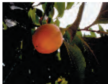
Photo 9. 尚州 Dungsì.