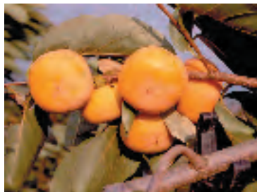
Photo 8. 清道柿.