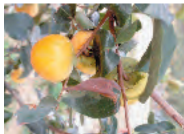
Photo 7. 高種柿.