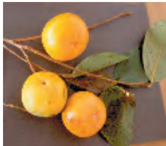
Photo 5. Mulgam.