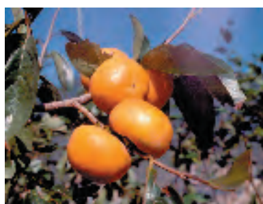
Photo 13. 早紅柿.