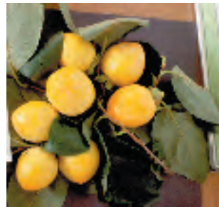
Photo 4. 丹城柿.