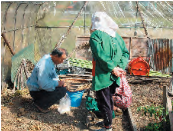
Photo 3. 生産者への聞き取り調査（岐阜県小坂町）.