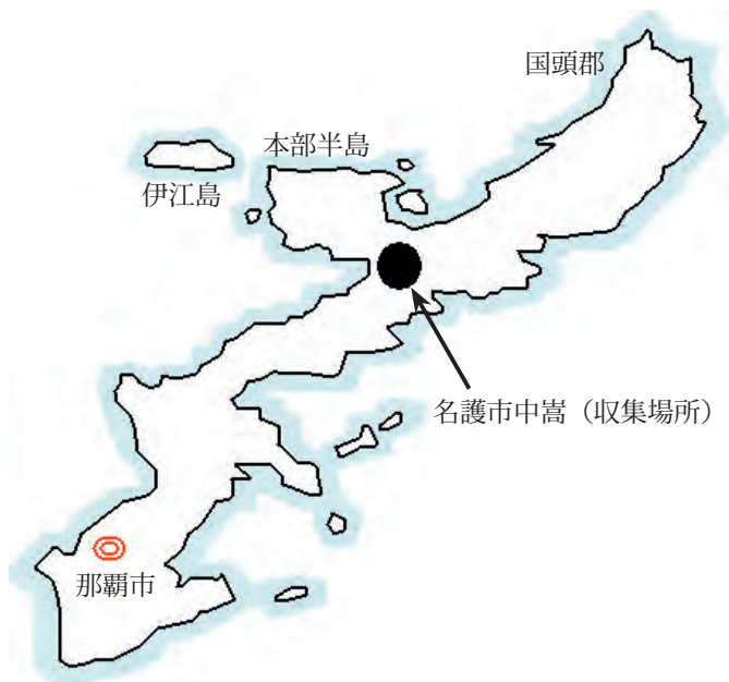
Fig.1. The collection site of tea seedlings.

沖縄県の茶園面積は2002年度で51haあり、その内訳は‘ゆたかみどり’が35ha、‘やぶきた’が4ha、その他の品種が8ha、実生茶園が4haで、品種化率は92%である。これらの品種はほとんどすべてが本土復帰後に導入されたものであり、急激な品種化により遺伝的多様性は急速に失われている。今回収集した比嘉猛氏所有の台湾由来の実生茶園は、1957年頃に台湾から導入された