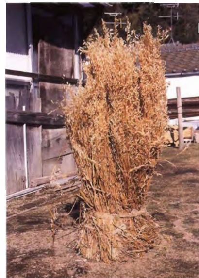
写真4. 脱穀後のエンバク 乾草として肉用牛に給与する.