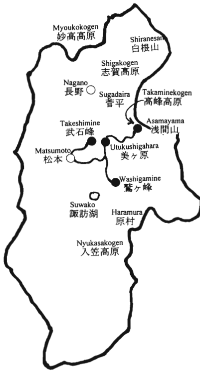
Fig.1 Exploration route (—) and collecting sites (●) in Nagano prefecture 長野県における探索経路 (—) と収集地点 (●)