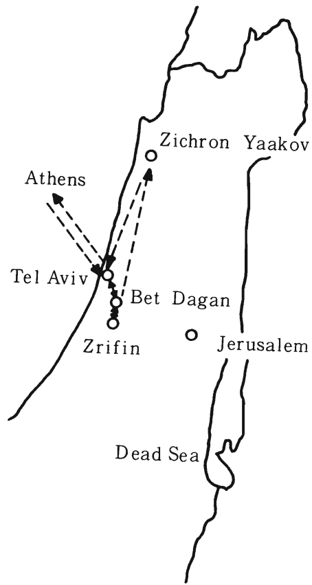
図3 探索行動図 (イスラエル)