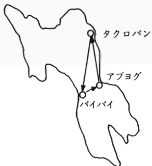
図2. 行動図 (フィリピン)