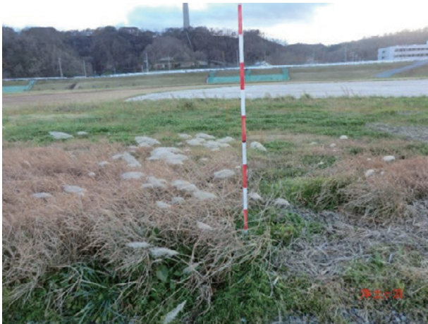
Photo 3. 宮古市閉伊川周辺の自生地の様子 (収集番号 16) A habitat of Miscanthus sacchariflorus Benthham in the region surrounding the Hei River in Miyako (Col. No.16)