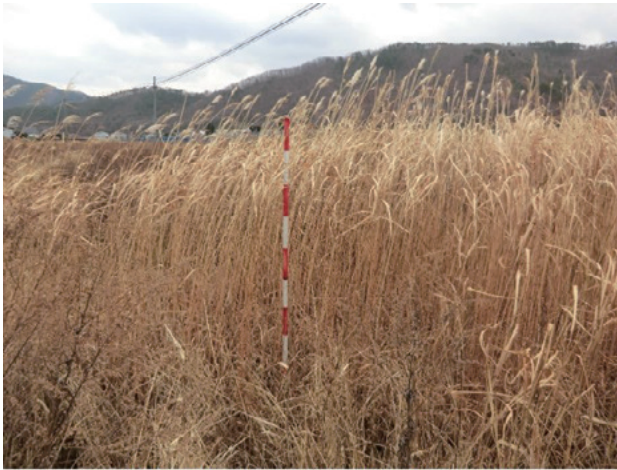
Photo 1. 岩手郡葛巻の自生地の様子 (収集番号 4) A habitat of Miscanthus sacchariflorus Benthham in the region surrounding the Tutiya River in Kuzumaki (Col. No.4).