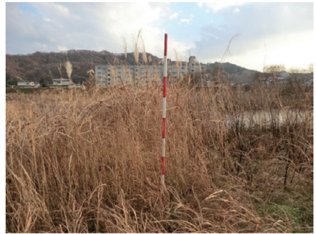
Photo 2. 久慈市久慈川周辺の自生地の様子 (収集番号 8) A habitat of Miscanthus sacchariflorus Benthham in the region surrounding the Kuji River in Kuji (Col. No.17).