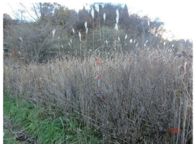
Photo 4. 宮古市閉伊川周辺の自生地の様子 (収集番号 18) A habitat of Miscanthus sacchariflorus Benthham in the region surrounding the Hei River in Miyako (Col. No.18).