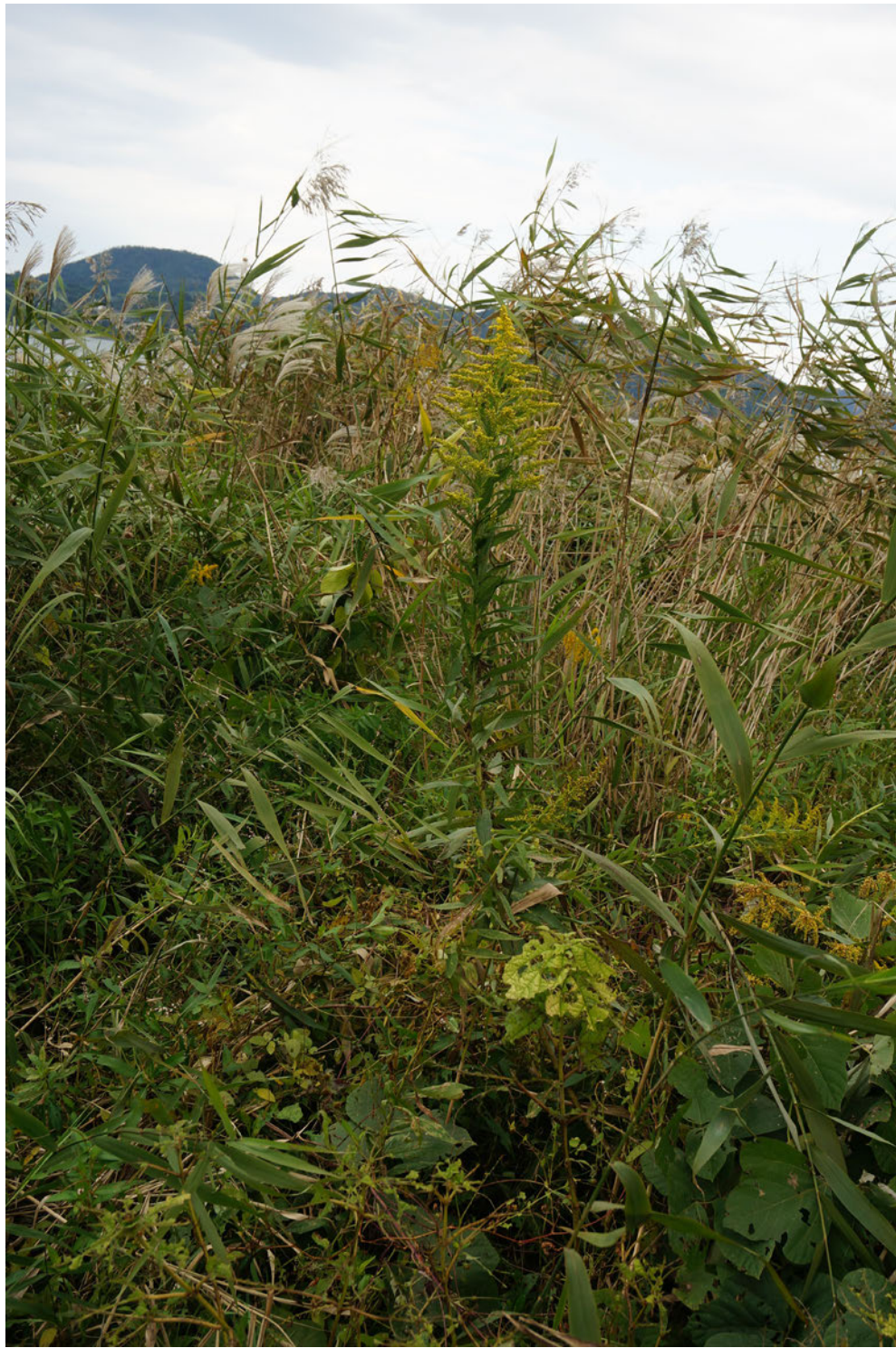
Photo 1. A wild soybean accession (JP253317) collected beside Lake Togo. 東郷湖の水辺で収集したツルマメ (JP253317 : COL/ 鳥取 /2014/ 近中四農研 /GS09)