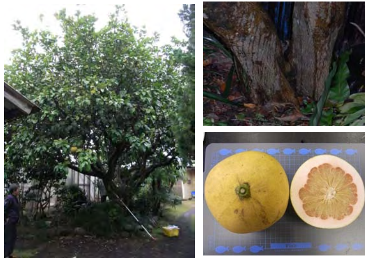
Photo 1 大賀郷地区に生育する「ウチムラサキ」 (左：ウチムラサキ樹体 右上：ウチムラサキ株元 右下：ウチムラサキ果実 (方眼:1cm)) 'Uchimurasaki' ( Citrus grandis ) grown in Ohkago area.