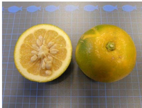
Photo 2 「カブツ」果実 (方眼:1cm) A fruit of 'Kabutsu' ( Citrus aurantium ).