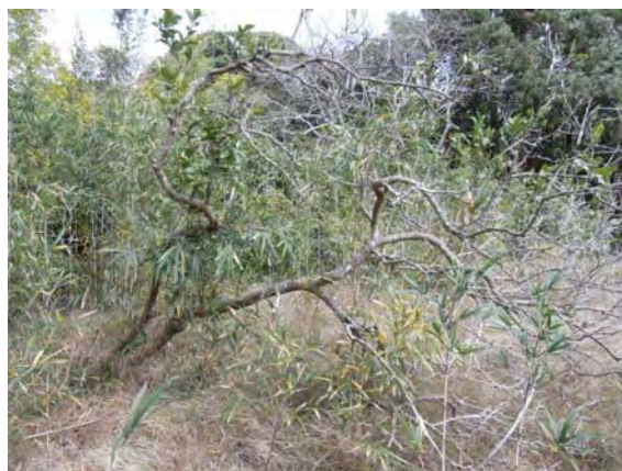
Photo 3 菊池レモン原木 An original tree of 'Kikuchi-lemon' ( Citrus limon ).