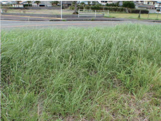
Photo 3. Population found near the mouth of the Umasako river, Shioyakitamachi, Makurazaki, Kagoshima; JW781. 鹿児島県枕崎市塩屋北町の馬迫川河口付近で発見した群落 (JW781).