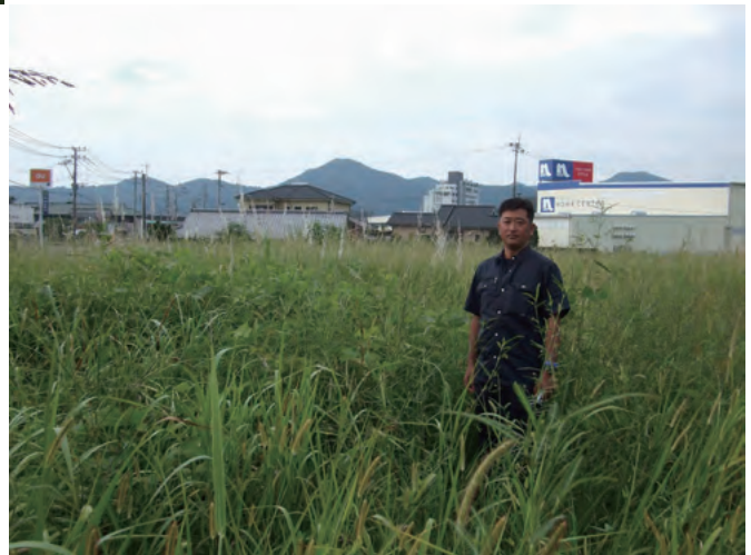
Photo 2. Population found in bush along the Okita river, Ishida-machi, Nobeoka, Miyazaki; JW780. 延岡市石田町の沖田川流域の茂みで発見した群落 (JW780).