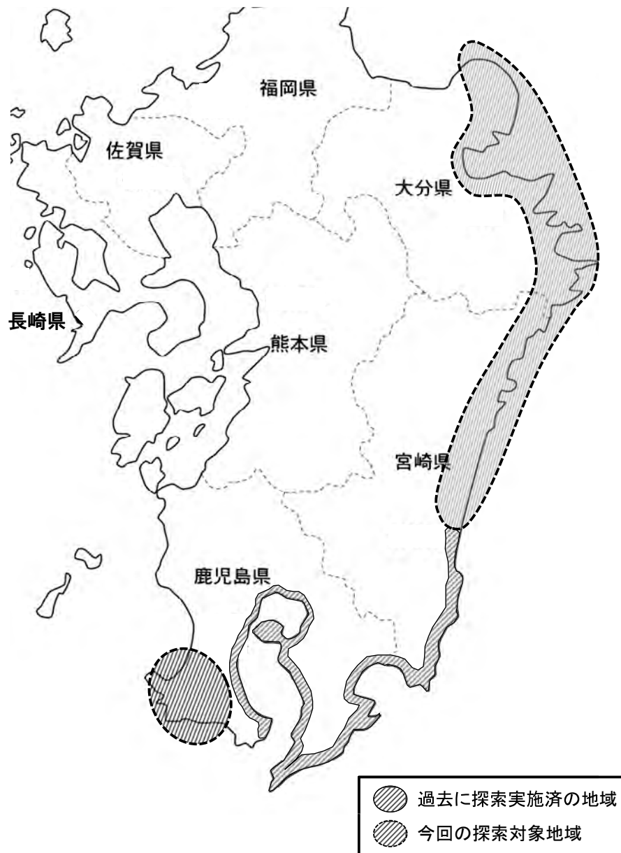
Figure 1. Previously and newly explored areas in Kyushu.