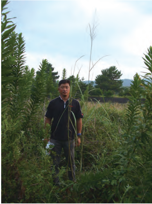
Photo 1. Population found in a bush near the mouth of the Akaiwa river, Okuragahama, Hyuga, Miyazaki; JW779. 日向市小倉ヶ浜の赤岩川河口付近の茂みで発見した群落 (JW779).