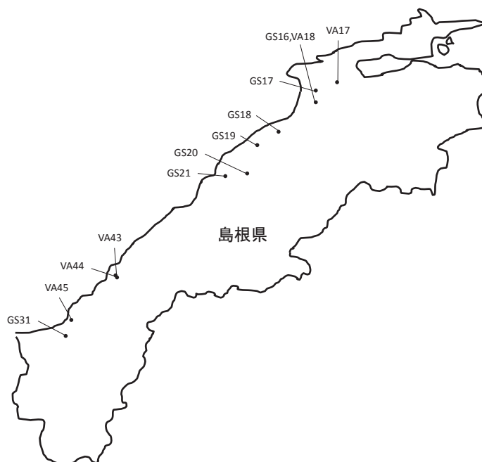
Fig. 2. Collection sites of wild soybean and wild azuki bean in Honshu area of Shimane prefecture.