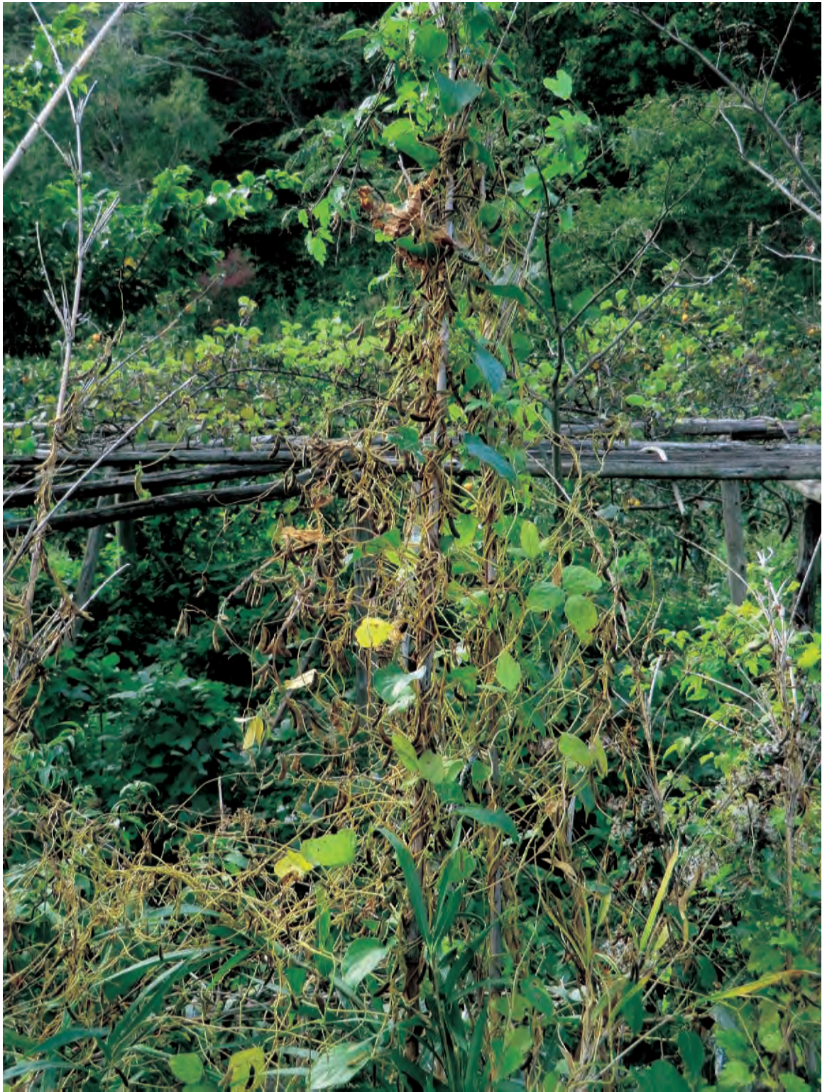
Photo. 1. A wild soybean collected at Chiburi island in Shimane prefecture.

島根県知夫里島で収集したツルマメ (COL/ 島根 /2012/ 近中四農研 /GS22)