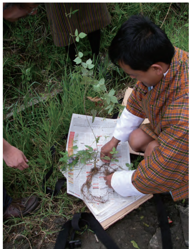
Photo 3. 野生ササゲ属植物の採取