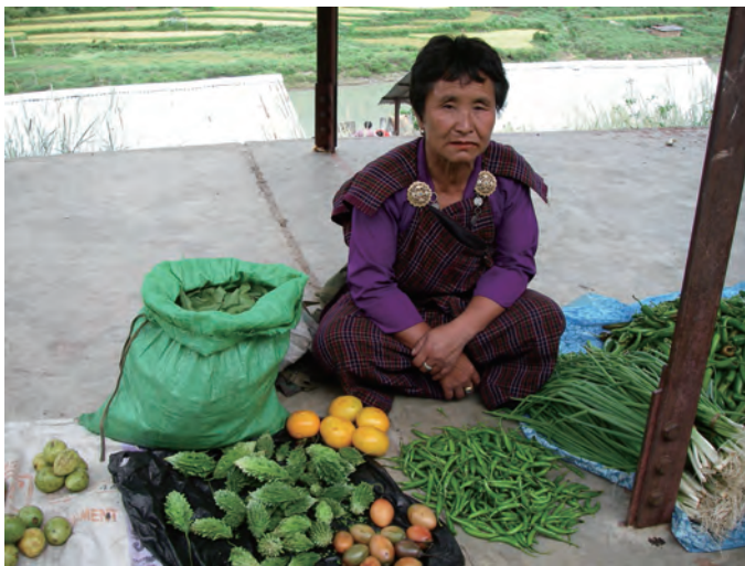
Photo 2. ワンデュポダンのマーケットの物産