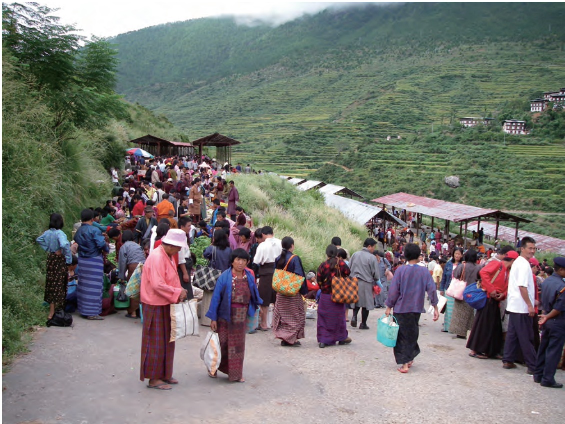
Photo 1. ワンデュポダンのマーケットと背景の棚田