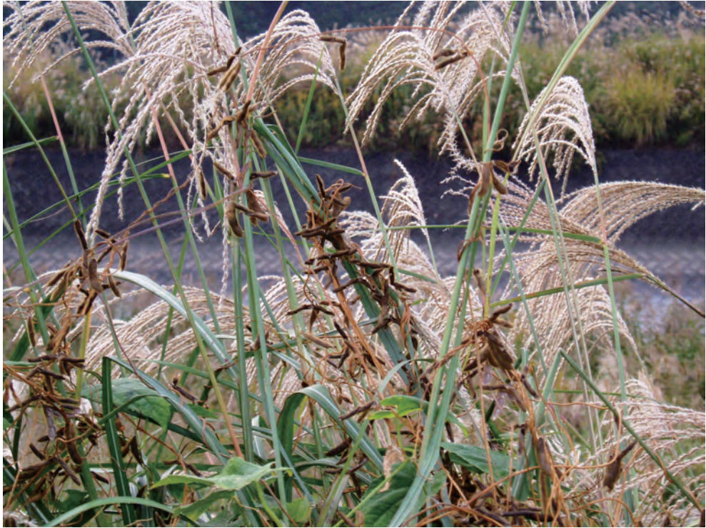
Photo 1. A wild soybean population twined around Miscanthus