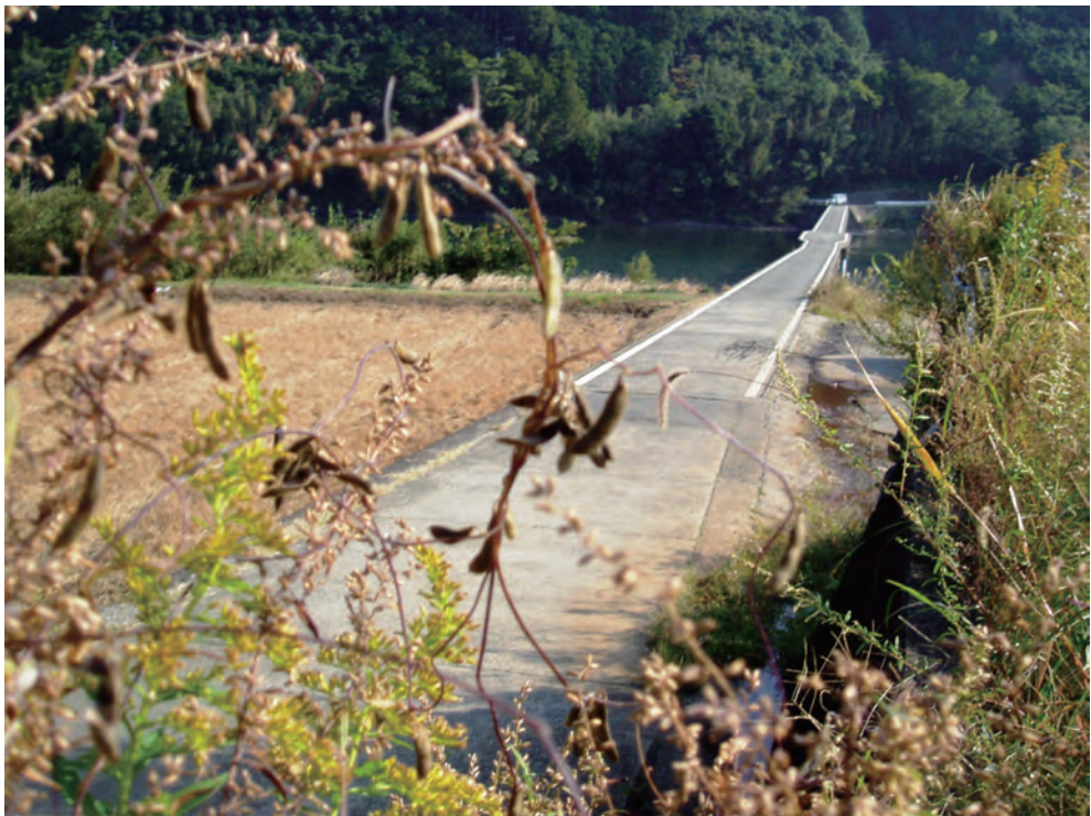
Photo 2. A wild soybean population beside Chinka-Bashi (sinker bridge) at Takase over Shimanto river.