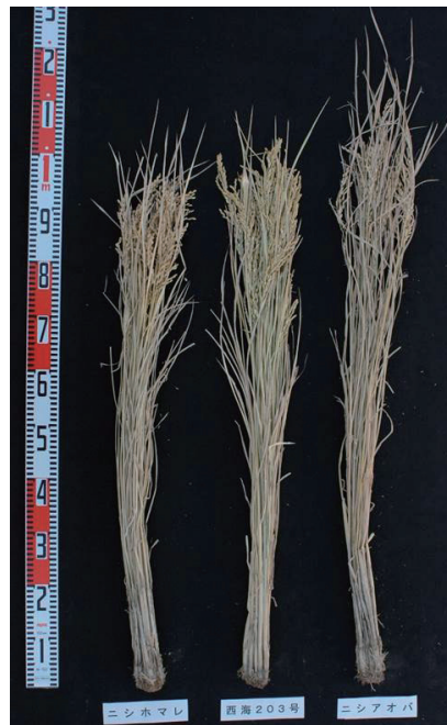
写真2. 普通期移植栽培標肥試験区のミズホチカラ株標本 (2008年) 左: ニシホマレ、中: ミズホチカラ、右: ニシアオバ