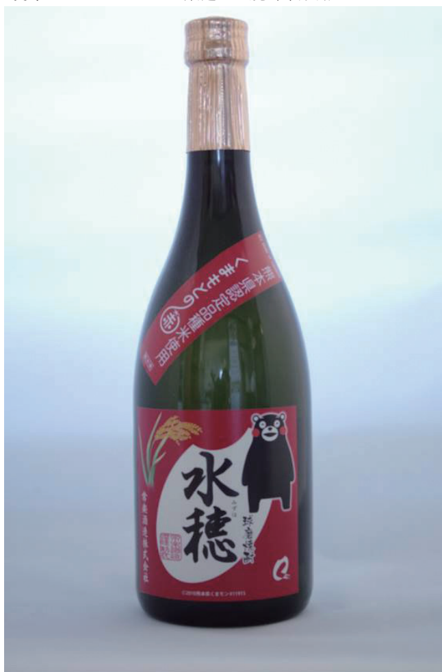
写真6. ミズホチカラで醸造した焼酎市販品