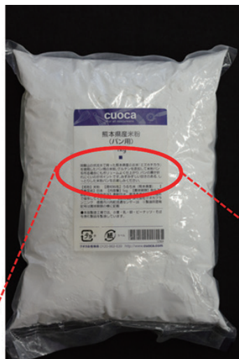
写真5. ミズホチカラの米粉市販品

阿蘇山の伏流水で育った熊本県産のお米「ミズホチカラ」を使用したパン用の米粉。グルテンを添加して米粉パンを作る場合にもボリュームよく仕上がり、パンの腰が折れにくいのがポイントです。みずみずしい甘さのある、しっとりした米粉パンをお楽しみください。