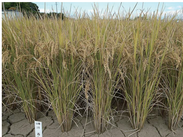
写真1. 普通期移植栽培標肥試験区のミズホチカラの草姿 (2007年、九州沖縄農業研究センター：福岡県筑後市)

一方、湛水直播栽培では、出穂期は「ユメヒカリ」より3日早く、成熟期は「ユメヒカリ」より8日晩生であり、育成地では“極晩生”である。耐転び型倒伏性(注:直播栽培で見られる“転び型倒伏”に対する耐性)は「ユメヒカリ」並かやや強い“やや強”である。稈長は「ユメヒカリ」と同程度である。穂長は「ユメヒカリ」より長い。穂数は「ユメヒカリ」より少なく、草型は“穂重型”である。熟色は「ユメヒカリ」並である。(第3-1表)。