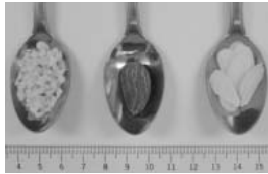
Fig. 1 Almond samples served to subjects Diced, whole, and sliced samples (1.3 g).

アーモンドを嫌いでない健常有歯顎者10名(女性、平均年齢±標準偏差32.1±6.1歳)を被験者として筋電位測定を行った。まず実験の目的や計測手法について説明し、インフォームドコンセントを得た。試料は、1粒のアーモンドの重量に合わせ、試料は全て1.30±0.03 gとした(Figure 1)。試料はランダム順に実験者がプラスチック製スプーンを用いて被験者に与え、被験者に普段通りに自由に咀嚼させた後、嚥下させた。その際に、既報 16) に従い、左右の咬筋および側頭筋前腹上の表面から、脳波用皿状電極を用いて筋電位を導出した。得られた筋電位は、アンプ(日本光電MEG-6108に4台の筋電位用アンプAB-610Jを装着)で1000倍に増幅した後、バイオパック社製MP150システムを用いてパソコンに取り込んだ。