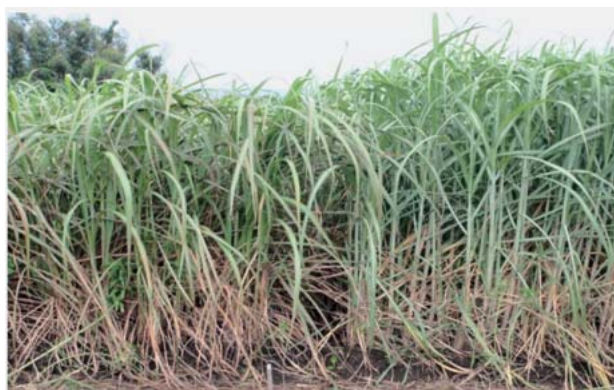
写真1 種子島での「やえのうしえ」の草姿（収穫4回目、2年目2番草）

「やえのうしえ」の形態的特性を第3表に、草姿を写真1に示す。調査は種苗特性分類（農林水産省2011）に基づき、年1回収穫体系で栽培した個体を対象とした。類似品種として飼料用品種「しまのうしえ」ならびに「KRFo93-1」、標準品種として製糖用品種「NiF8」を比較のため記載した（以下の生態的特性、耐病性なども同様とした）。なお、肥培管理は九州沖縄農業研究センター種子島研究拠点の慣行に準じた。