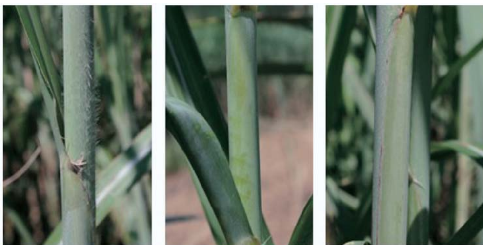
写真2 「やえのうしえ」の葉鞘の毛群

2015年5月、九州沖縄農業研究センター種子島研究拠点（鹿児島県西之表市）にて撮影