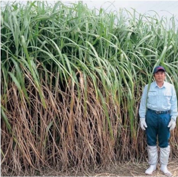
写真3 沖縄本島での「やえのうしえ」の草姿(収穫2回目, 1年目2番草) 2016年4月, 沖縄県南城市にて撮影

を示した。茎径は「しまのうしえ」よりもやや小さかった。蔗汁ブリックスは収穫1回目を除き、「やえのうしえ」は「しまのうしえ」より低かった。