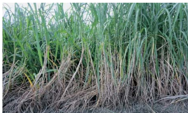
写真4 沖縄本島での「やえのうしえ」の耐倒伏性(収穫3回目,2年目1番草) 左:「しまのうしえ」,右:「やえのうしえ」 2016年8月,沖縄県南城市にて撮影

年1回収穫の製糖用サトウキビとは異なり、バイオマス生産性の高い飼料用サトウキビでは作期を分散させた年2回収穫体系で栽培される(境垣内ら 2015, 境垣内ら 2017)。茎が立った状態で収穫できるように年2回収穫の収穫適期を設定しているが、収穫適期を過ぎた場合には倒伏が生じやすい。特に、奄美沖縄地域で普及している「しまのうしえ」は耐倒伏性が弱いことが生産者から指摘されてきた。写真4の沖縄本島の年2回収穫体系での「やえのうし