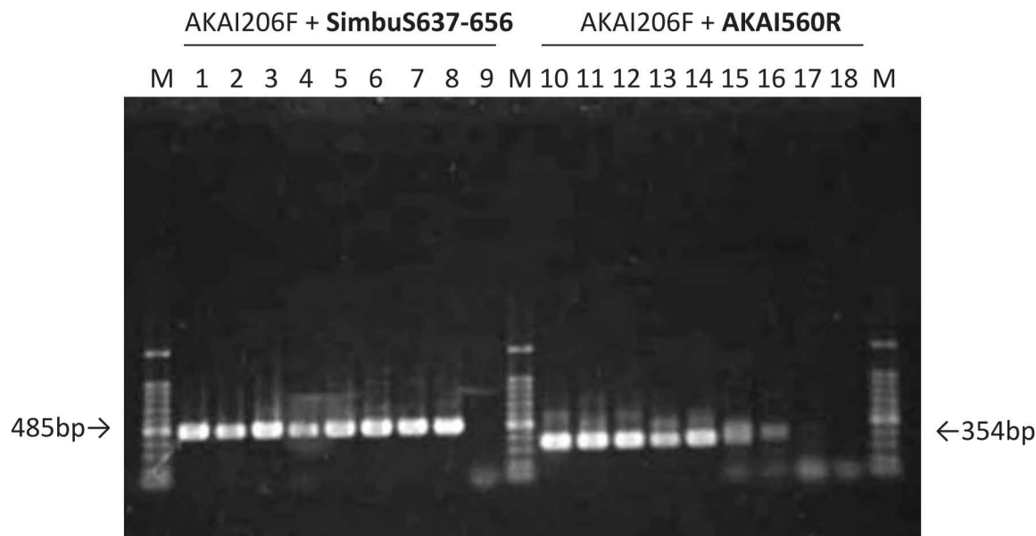
図1. AKAV および AINOV, PEAV, SHAV, SATV の代表株の新規および既報のプライマーセットを用いた RT-PCR による検出

AKAI206F と SimbuS637-656 (レーン 1 から 9, 増幅産物 485bp), AKAI206F と AKAI560R (レーン 10 から 18, 増幅産物 354bp) のプライマーセットを使用した。レーン 1 および 10: AKAV OBE-1 株, レーン 2 および 11: AKAV Iriki 株, レーン 3 および 12: AINOV JaNAr28 株, レーン 4 および 13: PEAV KSB-1/P/06 株, レーン 5 および 14: PEAV CSIRO110 株, レーン 6 および 15: SHAV KSB-6/C/02 株, レーン 7 および 16: SHAV An5550 株, レーン 8 および 17: SATV KSB-2/C/08 株, レーン 9 および 18: 陰性対照, レーン M: 100bp DNA ラダー