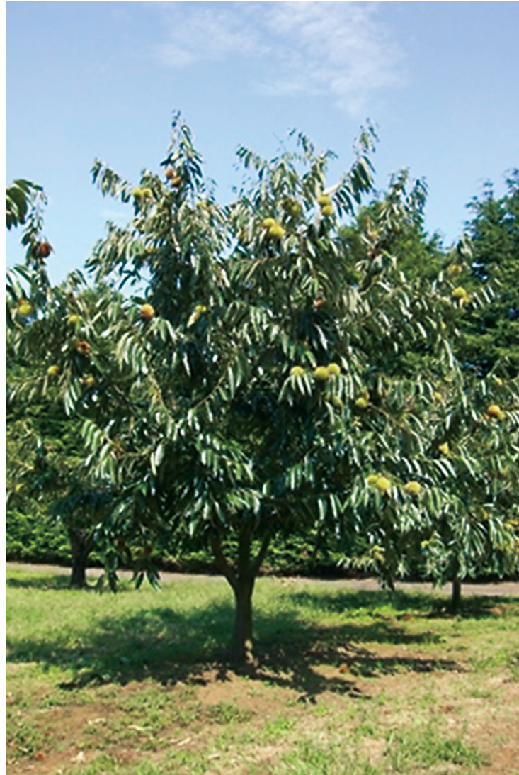
Fig. 2. Tree form of 'Mikuri' (tree age:12).