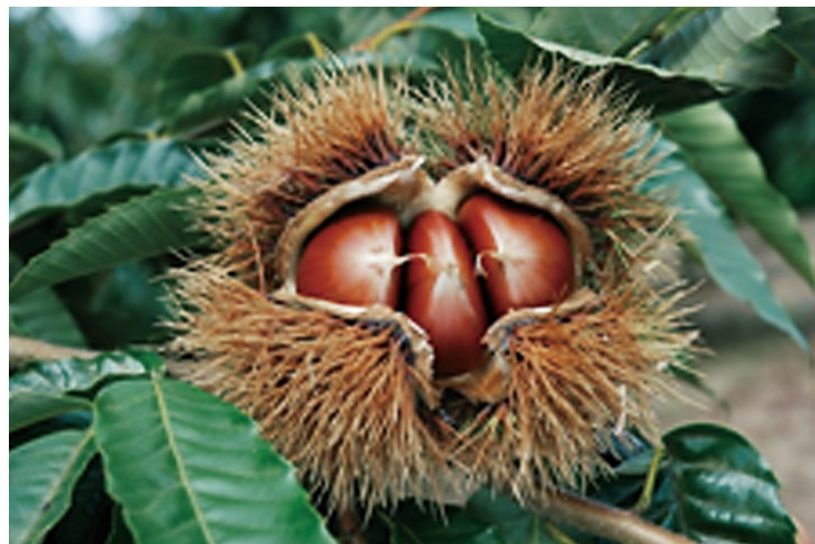
Fig. 3. Bur and nuts of 'Mikuri'.