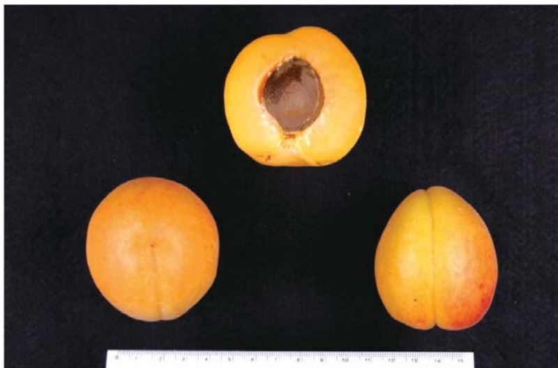
Fig.2. Tree shape (A), fruit bearing branch (B) and fruit (C) of ‘Ohisamacot’.