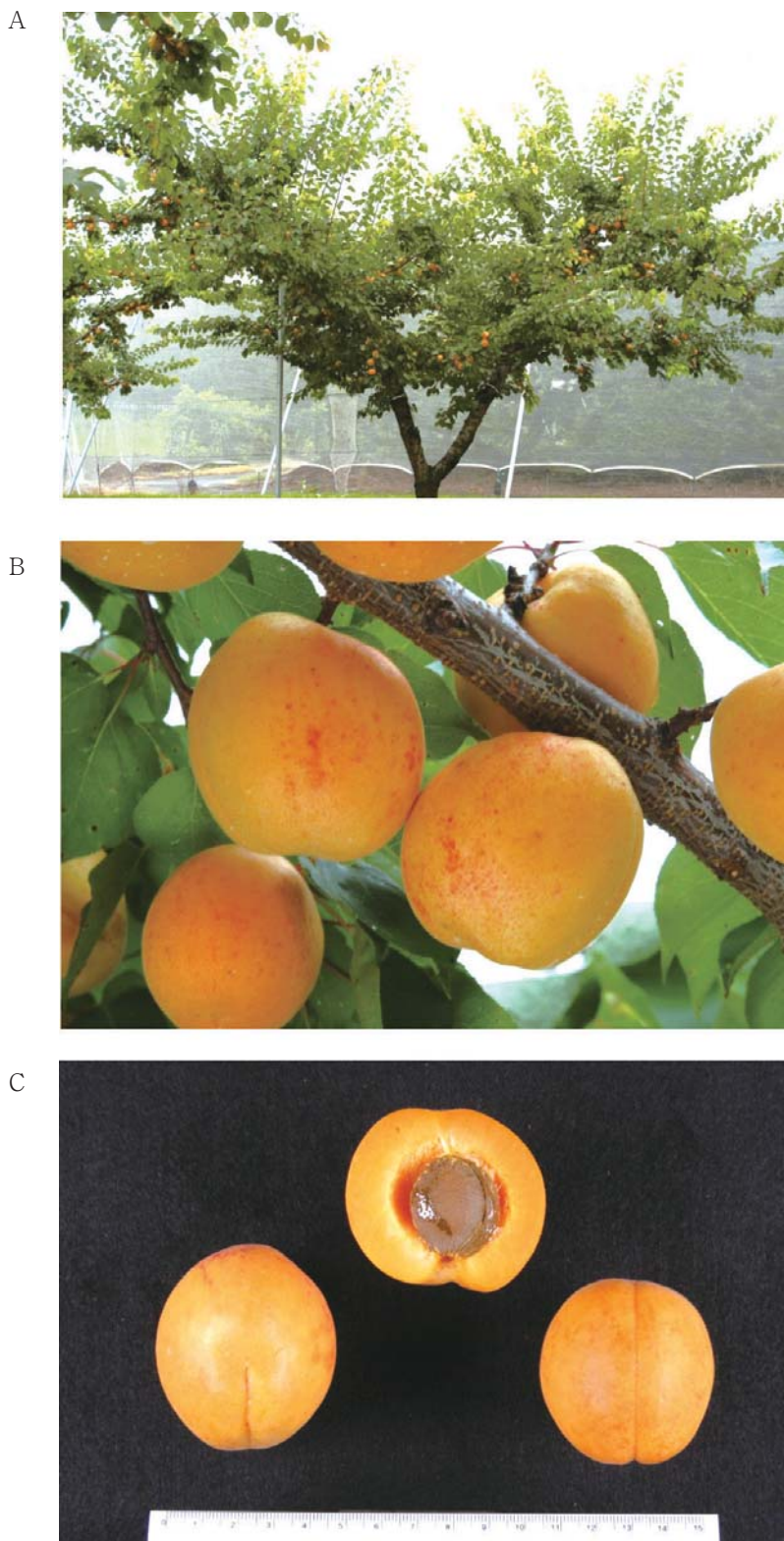
Fig.3. Tree shape (A), fruit bearing branch (B) and fruit (C) of 'Niconicot'.