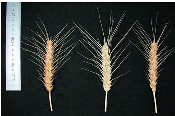
A B C