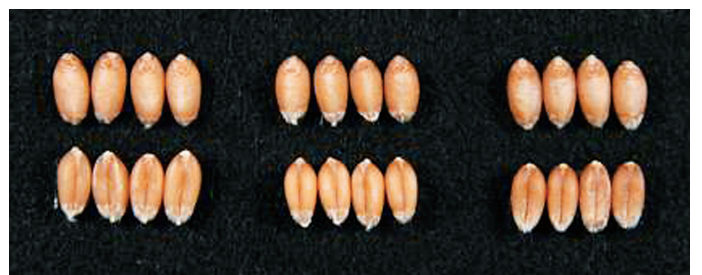
A B C