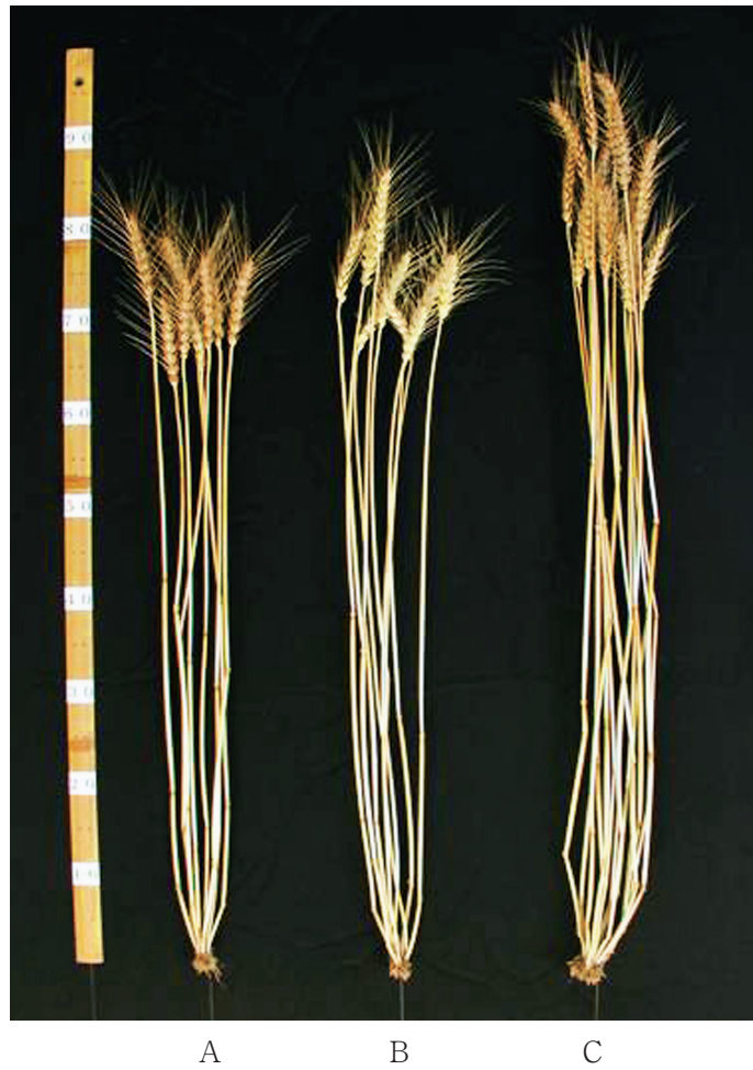
A B C