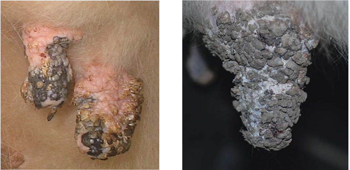
図3：BPV-9による難治性乳頭腫症の肉眼像