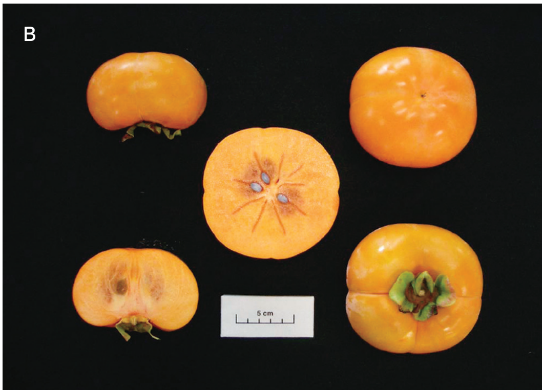
Fig. 2 Fruiting shoots (A) and fruit (B) of the 'Taiten' Japanese persimmon.