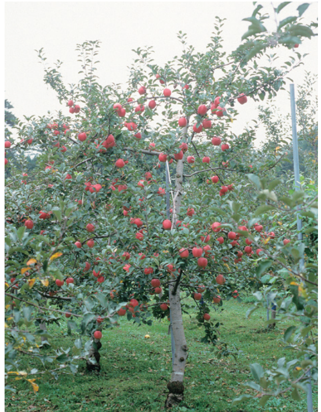
Fig. 2 Bearing tree of ‘Kotaro’ on M.26 (10-years-old).