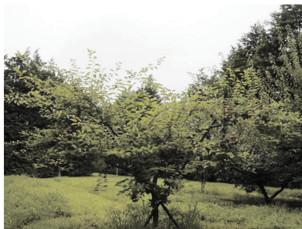
Fig. 2 Tree shape of ‘Tsuyuakane’.

果形は円形、果頂部の凹みはなく、梗あいの深さは中程度で広い。果実重は平均で66.5 gであり、‘南高’、‘白加賀’よりも大きい (Table 1)。果皮全面に鮮紅色に着色する。果面の毛じは短く、光沢のある美しい外観となる (Fig.4)。果肉も成熟に伴い、鮮紅色に着色し、梅酒や梅ジュースに加工した場合、きれいな紅色となる (Fig.5)。滴定酸度は平均で3.66 g/100 mlであり、‘南高’より1.86 g/100 ml、‘白加賀’より2.18 g/100 ml少ない (Table 1)。核は小さく、‘南高’の半分強程度