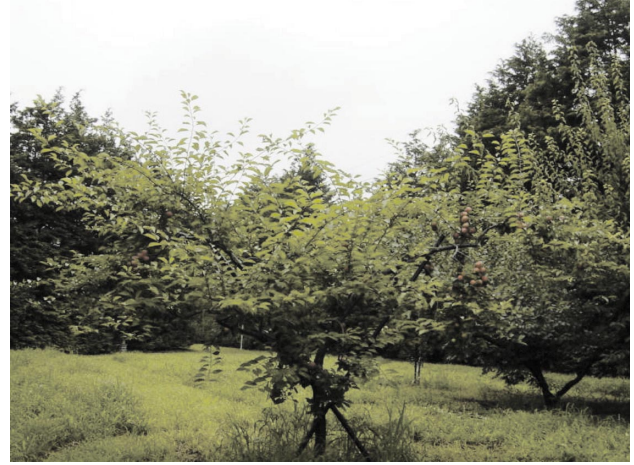
Fig. 2 Tree shape of ‘Tsuyuakane’.

果形は円形、果頂部の凹みはなく、梗あいの深さは中程度で広い。果実重は平均で66.5 gであり、‘南高’、‘白加賀’よりも大きい (Table 1)。果皮全面に鮮紅色に着色する。果面の毛じは短く、光沢のある美しい外観となる (Fig.4)。果肉も成熟に伴い、鮮紅色に着色し、梅酒や梅ジュースに加工した場合、きれいな紅色となる (Fig.5)。滴定酸度は平均で3.66 g/100 mlであり、‘南高’より1.86 g/100 ml、‘白加賀’より2.18 g/100 ml少ない (Table 1)。核は小さく、‘南高’の半分強程度