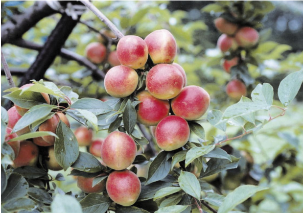
Fig. 4 Fruit branch of ‘Tsuyukane’.

1999年からウメ第2回系統適応性検定試験に供試し、育成地の果樹研究所を含め‘南高’と‘白加賀’を対照品種として育成系統適応性検定試験・特性検定試験調査方法（農林水産省果樹試験場，1994）により特性