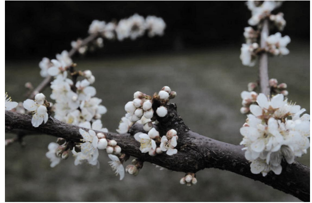
Fig. 3 Flower of ‘Tsuyuakane’.