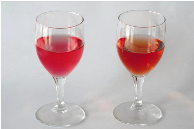
Fig. 5 Juice and fruit liquor of ‘Tsuyukane’.