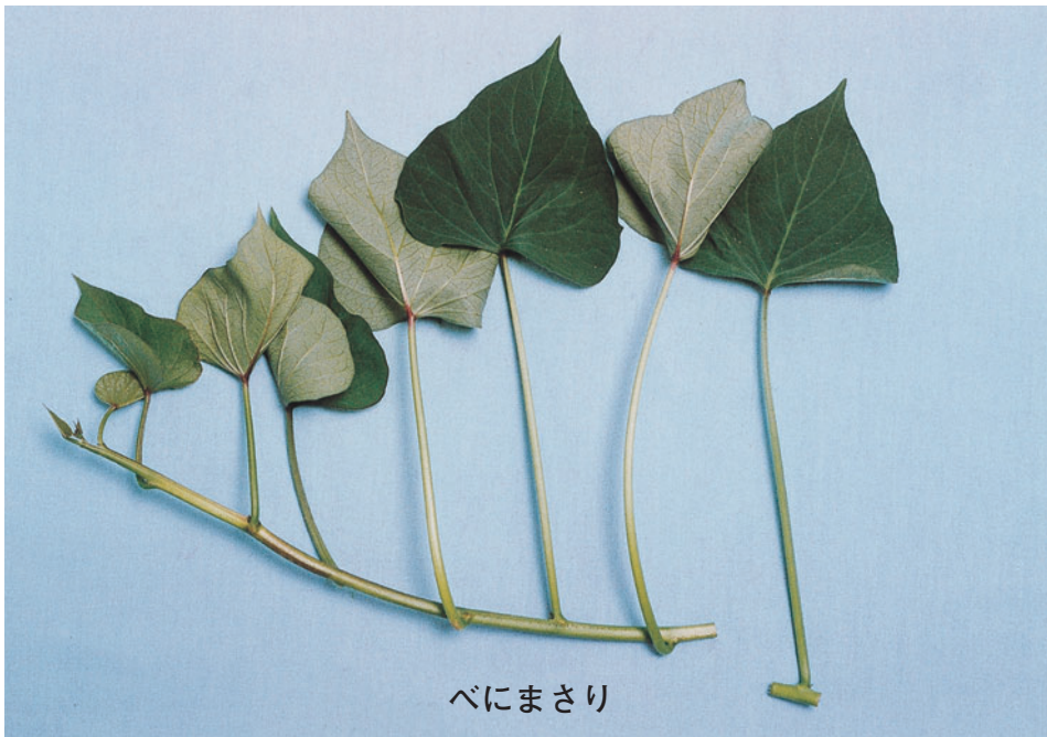
写真1 “べにまさり”の地上部