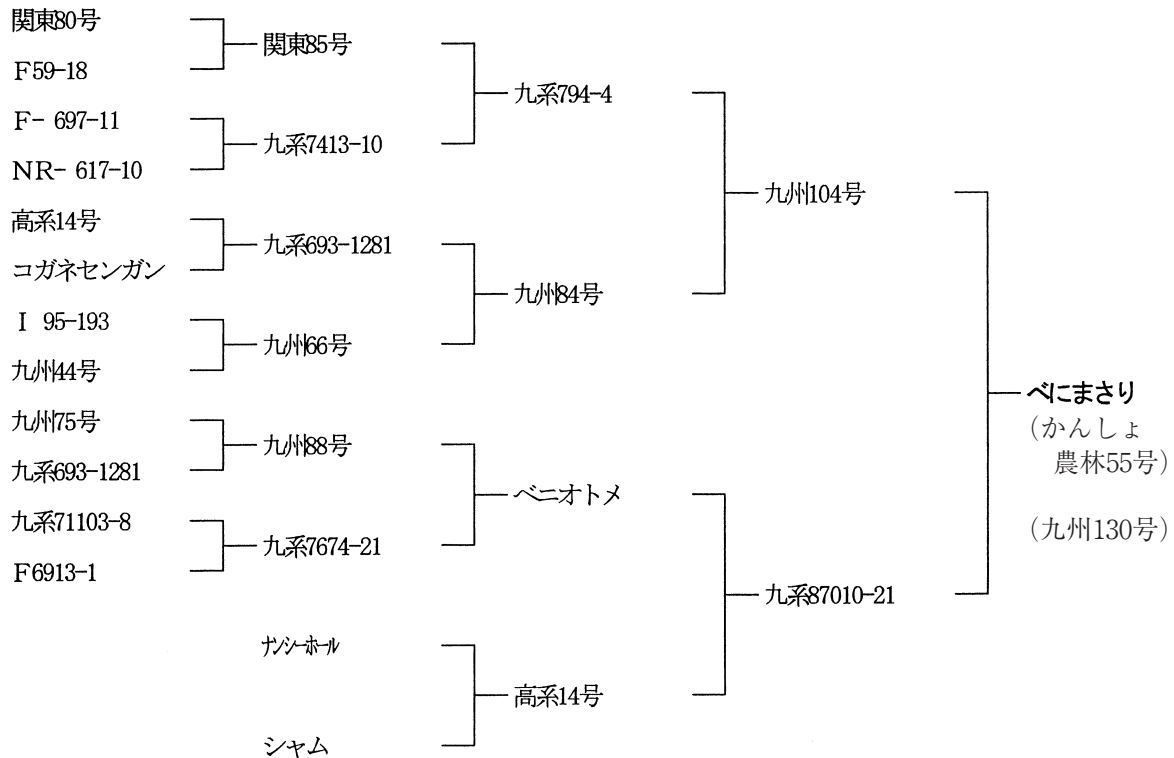
第1図 “べにまさり”の来歴

“べにまさり”は、皮色、食味に優れる“九州104号”を母、外観と食味に優れる“九系87010-21”を父とする交配組合せ（交配番号92015）から選抜した系統である（第1図）。交配採種は1992年に九州農業試験場畑地利用部甘しょ交配研究室（現農業技術研究機構九州沖縄農業研究センター畑作研究部サツマイモ育種研究室）で実施した。1993年以降、畑地利用部甘しょ育種研究室（現畑作研究部サツマイモ育種研究室）で第1表に示す経過で選抜・育成を行った。1993年の実生個体選抜試験でいもの外観および結しょ性に優れていたことから“九系92015-7”の系統番号を付した。以後1994年系統選抜予備試験、1995年系統選抜試験、1996年生産力検定予備試験に供試した。実用的特性を検討した結果、収量性や食味が優れていたため、1997年に“九系191”の系統番号を付して生産力検定試験、系統適応性検定試験（長崎県総合農林試験場、鹿児島県農業試験場大隅支場及び愛媛県農業試験場など）、地域適応性検定試験（徳島県農業試験場、宮崎県総合農業試験場など）、黒斑病抵抗性検定試験（長崎県総合農林試験場）、サツマイモネコブセンチュウ抵抗性検