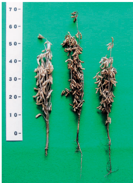
写真1 「すずおとめ」の成熟期の植物体 育成地、2001年7月3日播種 畦幅70cm, 株間14cm, 1株2本立

物機能開発部 大豆育種研究室）において、「納豆小粒」を母親に、「九系50」を父親に人工交配（九交228）して得られた品種である（第1図）。なお、「九系50」は、「Hill」を母親に、「みさお」を父親に人工交配（長交51）して得られた系統である。F 1 を育成後、F 2 世代からF 3 世代までは集団育種法により育成し、1991年のF 4 世代で105個体を選抜、1992年のF 5 世代で17系統群を選抜、以降、農業形質の調査を実施しながら選抜・固定を図った（第1表）。1994年には「九系191」の系統番号を付し、2年間の生産力検定予備試験、系統適応性検定試験に供試した。その結果、成績が良好であったので、1996年に「九州129号」の系統名を付し、生産力検定試験、奨励品種決定試験および現地実証試験に供試した。さらに、1997年には主要な形質について個体間および系統間の変異について検討した結果、「すずおとめ」の主要形質における変異は「アキシロメ」及び「ニシムスメ」とほぼ同程度で、実用的に支障ないと認めた（第2表）。一方、1994年から2001年にかけて、長野県中信農業試験場でダイズモザイクウイルス病抵抗性、福島県農業試験場会津地域研究支場で紫斑病抵抗性、岩手県農業研究センターで黒根腐病抵抗性、栃木県農業試験場黒磯分場でダイズシストセンチュウ抵抗性、鹿児島県農業試験場大隅支場でアレ