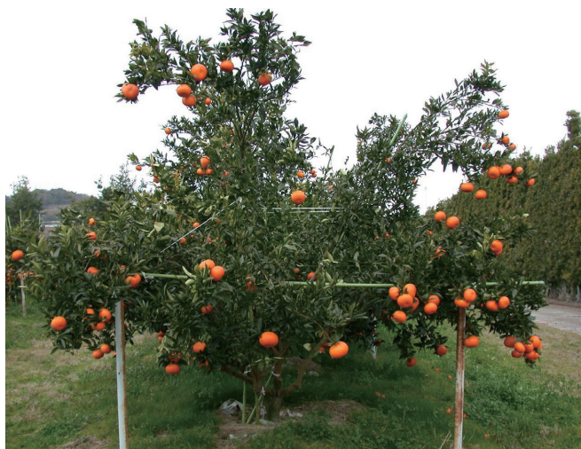
Fig.3 Bearing tree of 'Reikou'