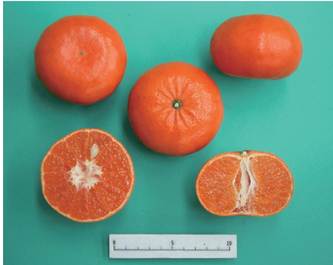
Fig.2 Fruit of 'Reikou'