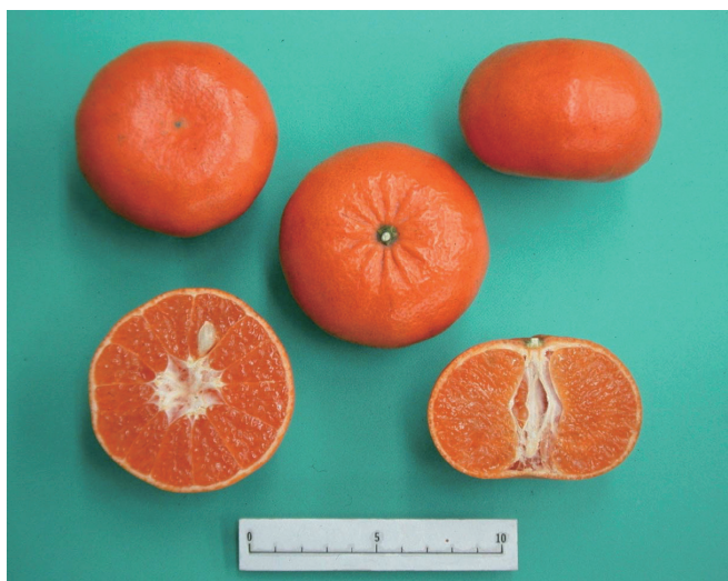
Fig.2 Fruit of 'Reikou'